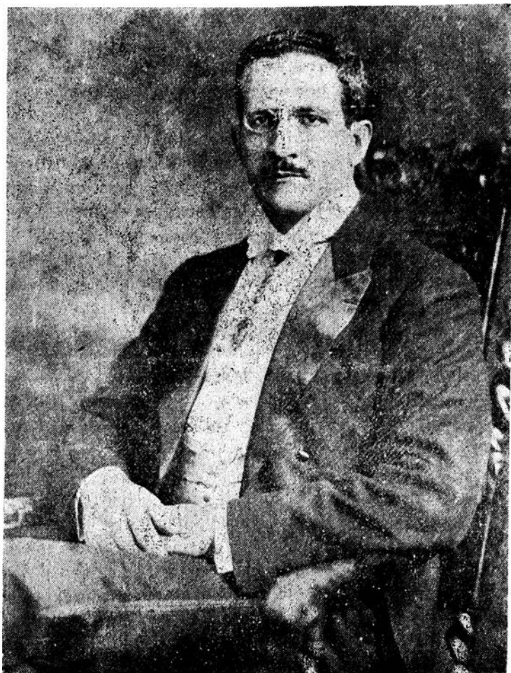
EXCMO. SEÑOR DOCTOR RICARDO J. ALFARO